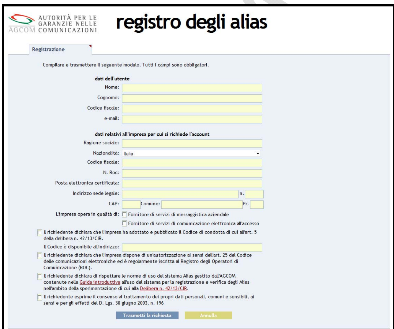
Figura 2 – pagina di registrazione.

Completato l'inserimento dei dati richiesti, occorre premere il pulsante "Trasmetti la richiesta".