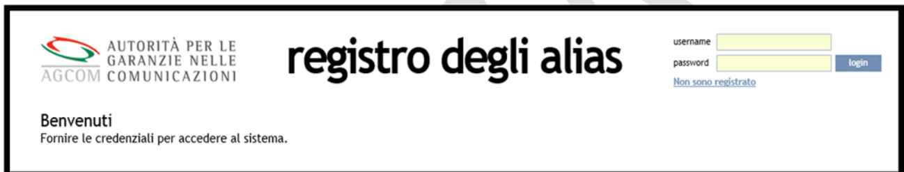
Figura 1 – home page del sistema Alias .

Il singolo soggetto autorizzato ex art. 25 del Codice delle comunicazioni elettroniche come “fornitore di servizi di messaggistica aziendale” o “fornitore di servizi di comunicazione elettronica”, per effettuare la registrazione deve accedere alla home page del sistema Alias ( https://www.alias.agcom.it ) e utilizzare il link “Non sono registrato”.